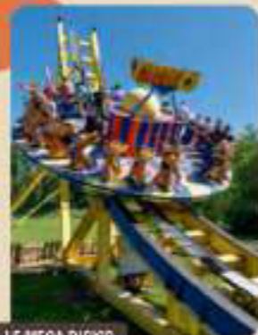
LE MEGA DISKO