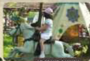
LE GRAND CANYON