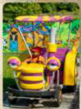
LES TRACTEURS RIDOLES

Préparez-vous à des aventures douces et amusantes !