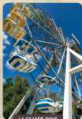
LA GRANDE ROUE