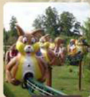
LE DIDI MONORAIL