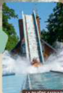
LA RIVIÈRE SAUVAGE

Accrochez-vous bien... sensations fortes !