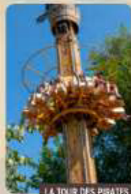
LA TOUR DES PIRATES